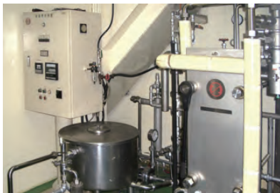
プレート殺菌設備

50ml の場合 : 1 ケース 50 本入 (50ml が 1 箱に 10 本入 × 5 箱) 100ml の場合 : 1 ケース 50 本入 (100ml が 1 箱に 10 本入 × 5 箱) のみとなります。