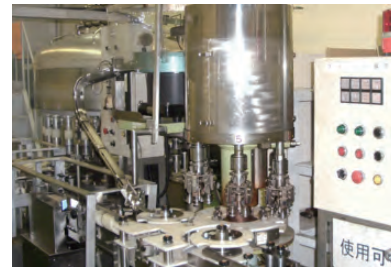
全自動 PP キャップ巻締機